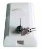
Coin box for collecting users' charge