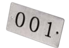
Plaque numérotée Pour une identification facile