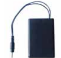
Emergency power supply