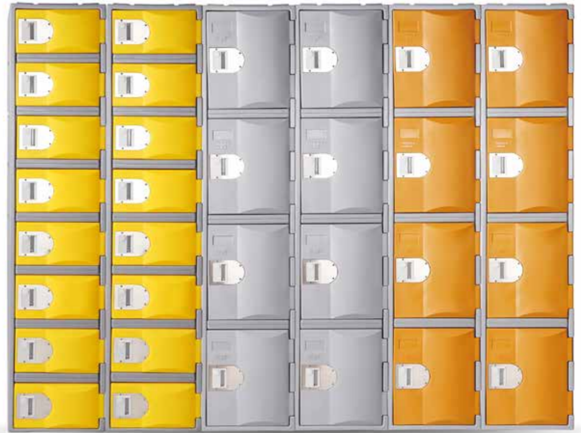
CVMPE385XL4 & CVMPE385XL8