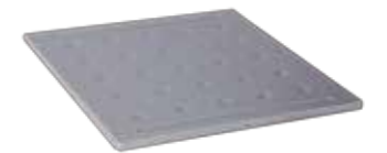
Tablette Pour bien exploiter les casiers