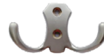
Crochet Pour suspendre des vêtements et autres petits articles