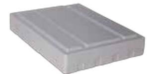
Socle Rendre le casier inférieur plus facile d'accès