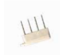
Probe to retrieve the lost pass code