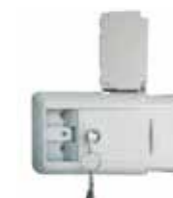
Coin Retain Box