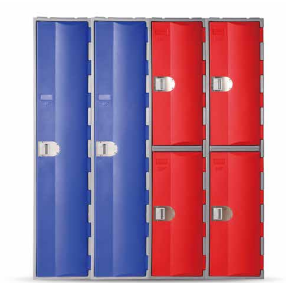
CVMPE385XL1 & CVMPE385XL2