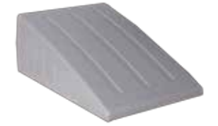
Coiffe inclinée Empêche que des objets soient mis sur le dessus des casiers et limite la poussière