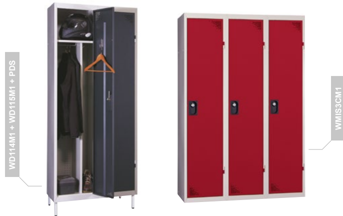
WD114M1 + WD115M1 + PDS

Ce vestiaire métallique vous permet un usage intensif en respectant la séparation indispensable et réglementaire entre vêtements de travail et civils.