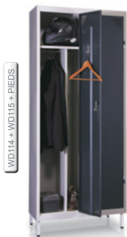
WD114 + WD115 + PIEDS