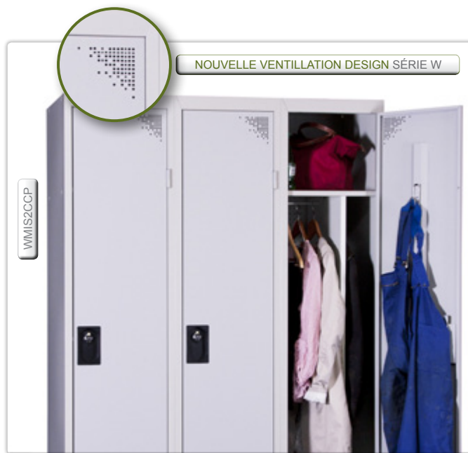
NOUVELLE VENTILLATION DESIGN SÉRIE W

La série W est disponible dès maintenant ! Pour commander dans cette nouvelle série, remplacer V par W en début de référence.