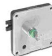
Serrure à Monnayeur SERR_MOY